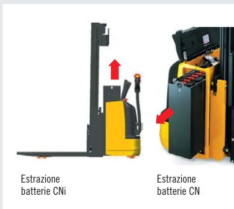
Estrazione batterie CNi