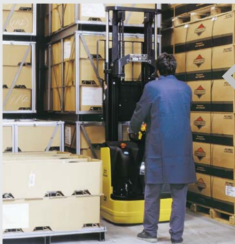
Estrazione batterie CN