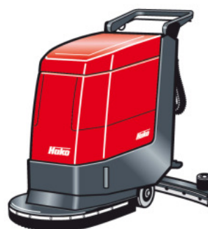
Hakomatic E 530