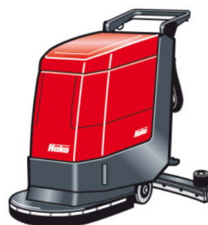
Hakomatic B 450