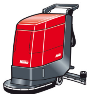
Hakomatic E 450